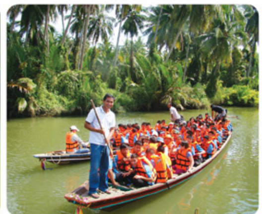
ล่องเรือคลองน้อย