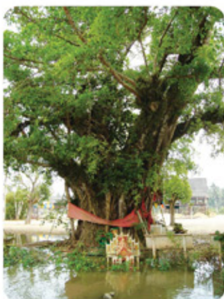
ต้นไทรเท็งกระตุก วัดบุญบันเท็ง