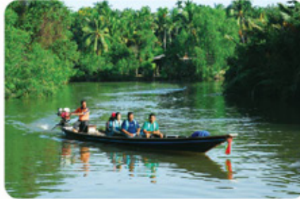
ล่องเรือชมวิถีคนคลองน้อย