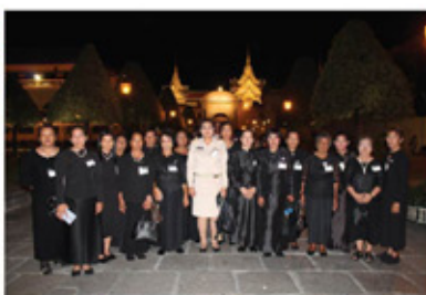
ศึกษาดูงาน ไท่พระบรมศพ