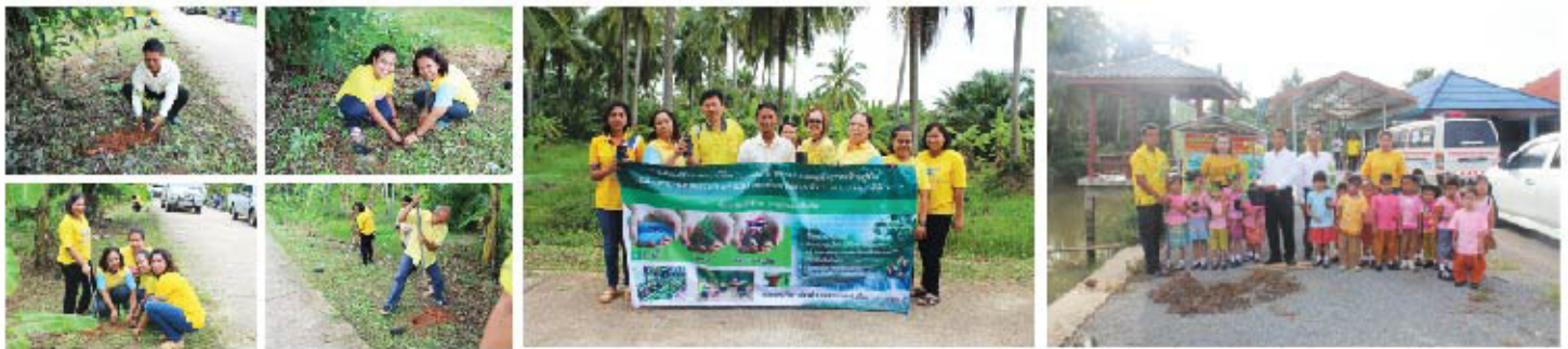
... ปลูกต้นไม้เฉลิมพระเกียรติ ...