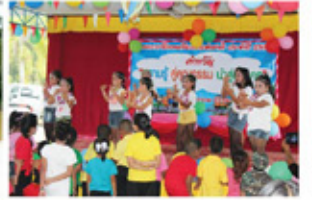
งานวันเด็ก