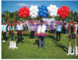
กีฬาต้านยาเสพติด