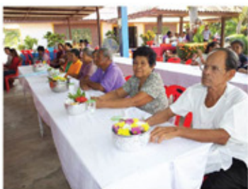
รดน้ำผู้สูงอายุ