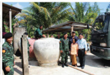
ช่วยเหลือภัยแล้ง