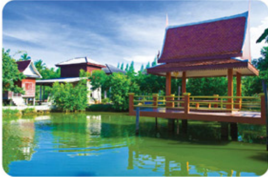
วัดบุญบันเท็ง