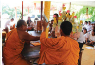
แห่เทียนพรรษา