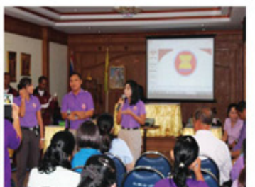
อบรมให้ความรู้เกี่ยวกับอาเซียน