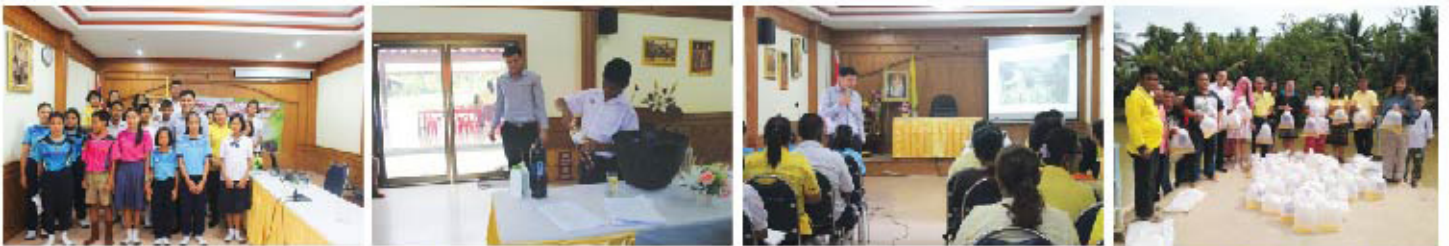
... โครงการรณรงค์คัดแยก ...