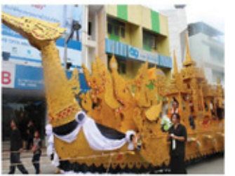
ประเพณีชักพระทอดผ้าป่า