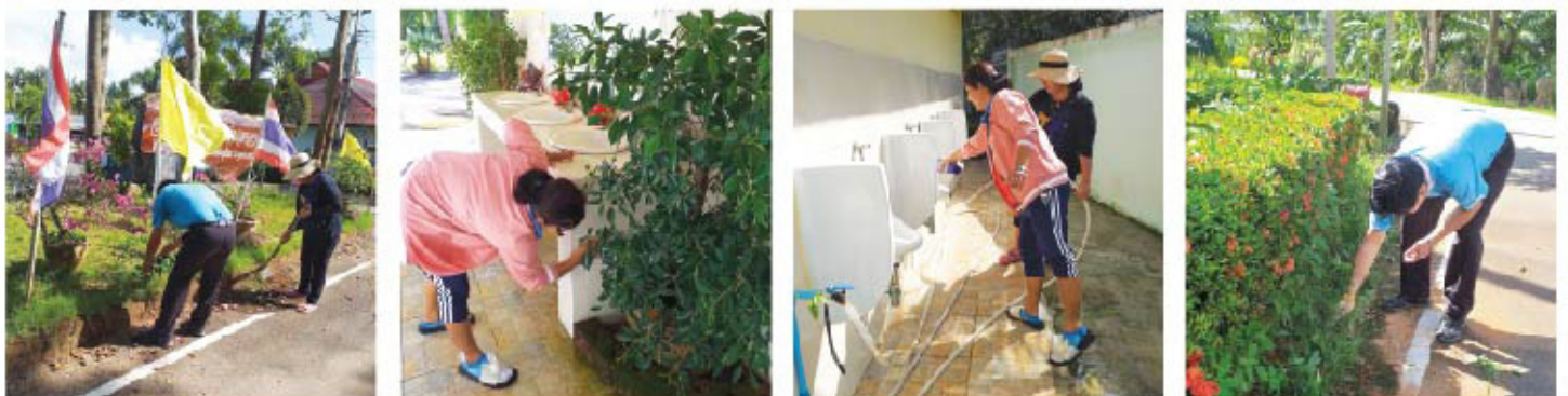
... กิจกรรม Big cleaning day ...