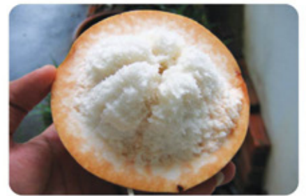
กระท้อนของดีคลองน้อย