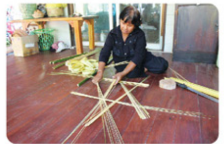
เรียนรู้การจักสาน