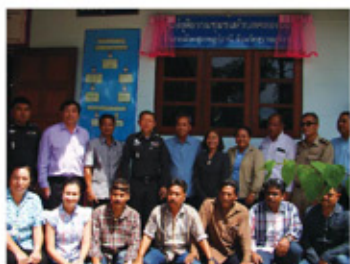
ศูนย์ยุติธรรม