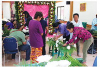
ฝึกอบรบอาชีพ