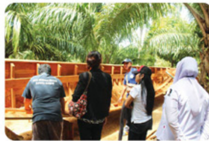
อู่ต่อเรือ