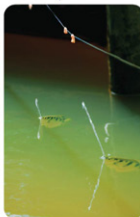
ปลาเสือพ่นน้ำ