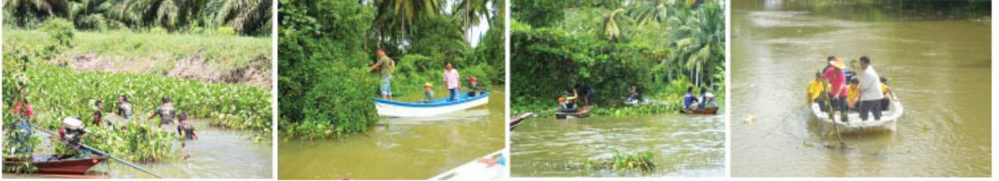
... โครงการคลองสวยน้ำใส ...