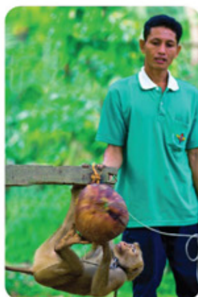
โรงเรียนฝึกลิง