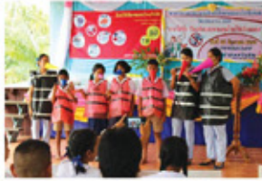
โครงการอบรมความรู้เพื่อลดออก