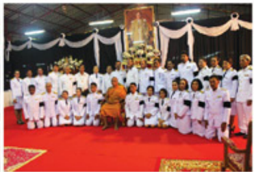
สวดพระอภิธรรม 9-11พ.ย. 59