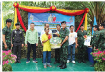
ทหารสร้างบ้าน ให้กับผู้สูงอายุ