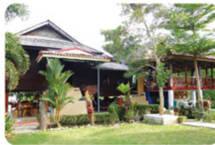
โฮมสเตย์คลองน้อย