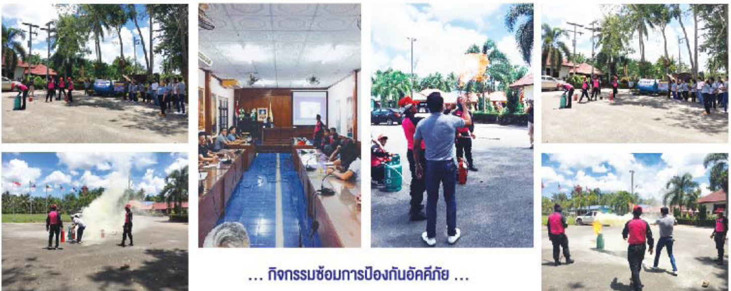
... กิจกรรมซ้อมการป้องกันอัคคีภัย ...