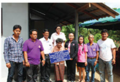
สร้างบ้านผู้สูงอายุ