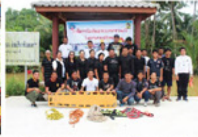
งานป้องกันและบรรเทาสาธารณภัย