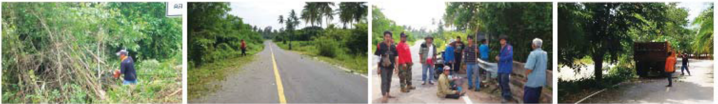
... พัฒนาข้างถนน ...