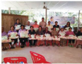
ช่วยเหลือผู้สูงอายุ ผู้คนพิการ คนยากไร้