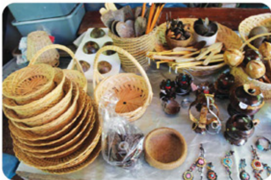
ผลิตภัณฑ์ที่จากรสาน และกะลามะพร้าว