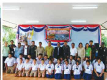
อบรมยาเสพติด