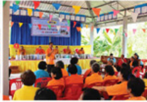
งาน อบรม อสม.