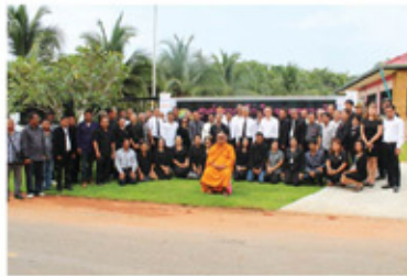
เปิดศูนย์พัฒนาเด็กเล็ก