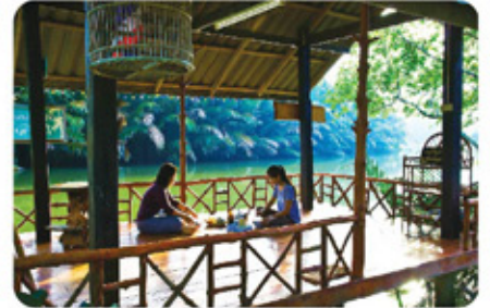
ล่องเรือชมวิถีคนคลองน้อย