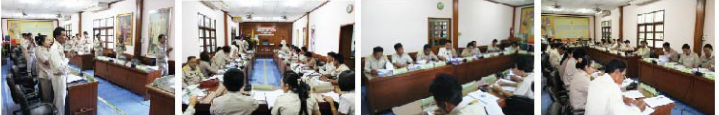
... ประชุมสภา องค์การบริหารส่วนตำบล ...