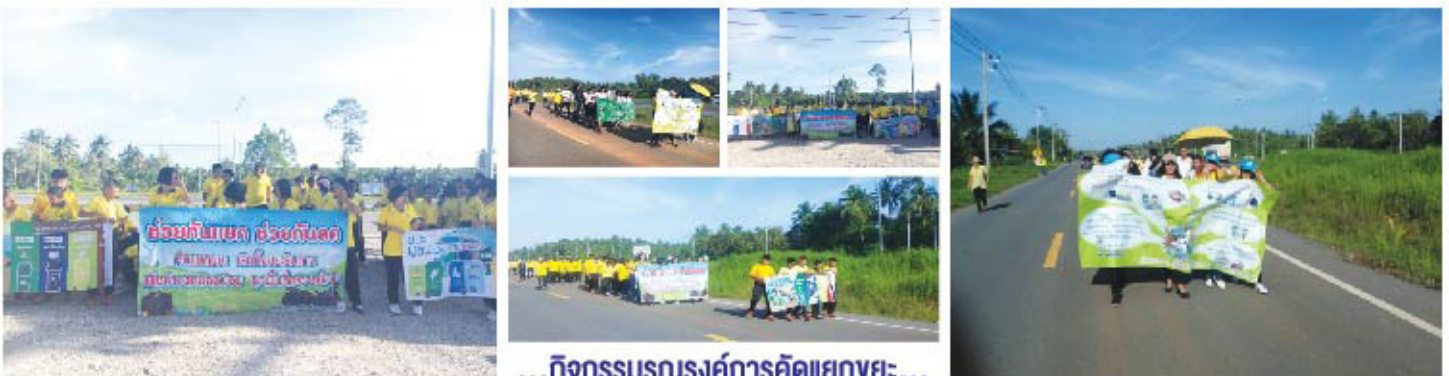
... กิจกรรมรณรงค์การคัดแยกขยะ...